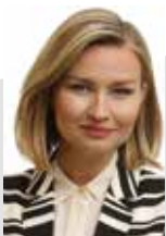
Ebba Busch Thor, Uppsala

Flexibel föräldraförsäkring där dagar kan överföras mellan föräldrar och närstående.